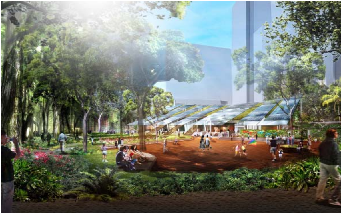
Zero carbon building cum open space 零碳建築物及公眾空間