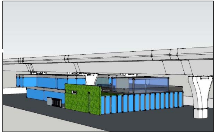
Perspective View 1