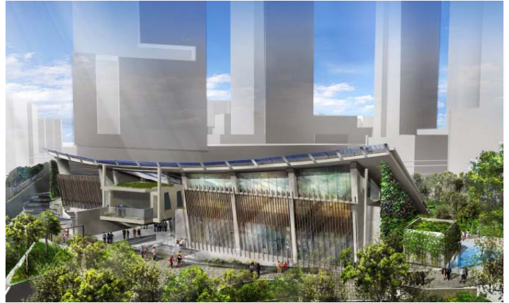
Zero Carbon Building 零碳建築物