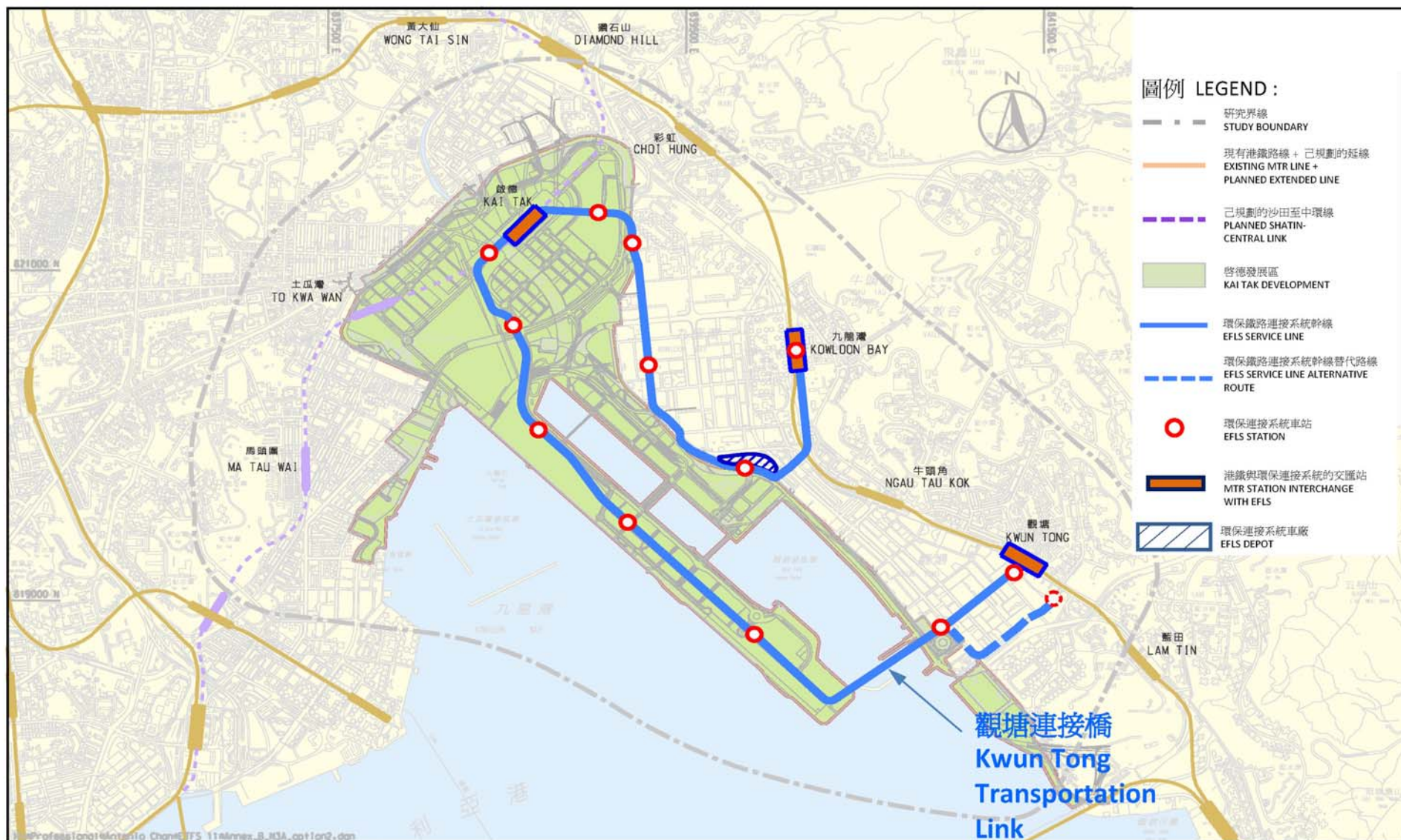
擬議的鐵路環保連接系統走線圖 (2011年9月) Proposed Rail-based EFLS Alignment Plan (September 2011)