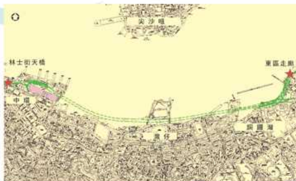
建議的中環灣仔繞道路線圖